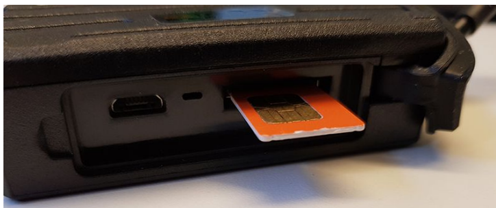
ezTracker Fordon G1

Man kan behöva använda en nagel eller t.ex. kanten av kortet SIM-kortet kom i för att klicka in SIM-kortet korrekt. När kortet är korrekt lyser den gröna och blåa dioden bredvid.